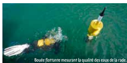
Bouée flottante mesurant la qualité des eaux de la rade.

Des mesures dites de « compensation » ont été prises pour préserver à plus grande échelle les équilibres écologiques perturbés par le chantier. À Plougastel-Daoulas, deux biotopes équivalents à ceux détruits sur le polder sont en cours de restauration. Au lieu-dit Fontaine blanche, une peupleraie artificielle de trente ans d'âge (8 600 m 2 ) a été réhabilitée en prairie humide. Trois mares ont été creusées. Un sentier pédagogique permet d'observer au fil des saisons la vie d'un site redevenu naturel. Où le crapaud épineux et l'alyte accoucheur ont déjà repris leurs habitudes. Sur le littoral, un milieu de landes sèches et hautes s'enracine au Fort du Corbeau pour offrir à la linotte mélodieuse, une espèce nicheuse en déclin, un habitat propice à sa conservation.