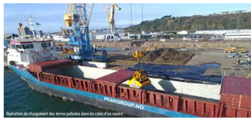
Opération de chargement des terres polluées dans les cales d'un navire.

février et mars 2018 par bateau jusqu'aux Pays-Bas. Lavées à l'eau, elles seront réutilisées dans la construction de bâtiments et de chaussées routières. Elles seront valorisées au lieu d'être enfouies. Les terres peu polluées représentent un volume plus important (40 000 m 3 ). Conformément à la réglementation, la Région Bretagne a choisi de les stocker sur le polder en prenant toutes les précautions nécessaires. Déplacées et compactées, ces terres seront « encapsulées » cet été sous une membrane étanche, recouverte de matériaux inertes puis de terre végétale. Elles formeront l'ossature du merlon paysager qui offrira aux promeneurs une vue imprenable sur la rade et les activités du port. Très contrôlé, le procédé ne présente aucun risque sanitaire ni environnemental.